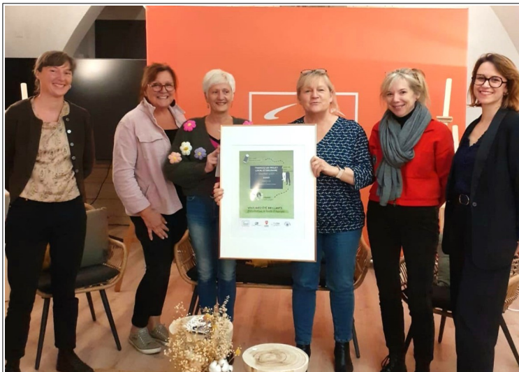
Soirée remise des prix j'adopte un projet 03 décembre 2024

Grâce à notre participation à la campagne de financement participatif " J'adopte un projet " nous proposons à nos adhérents un stage de cinq jours au cours duquel nous les initierons à la BD grâce à un tutorat d'auteur(trice)s de BD reconnus, une visite du Musée de la bande dessinée, un stage de dessin en présence d'un auteur(trice) et le montage d'un scénario et/ou d'une planche avec pour objectif de participer au concours de la BD scolaire.